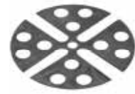
U-E10 (T- 1mm) U-E20 (T- 2mm)