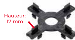
Epaisseur: 2, 3 et 4,5mm