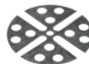
U-E10 (T- 1mm) U-E20 (T- 2mm)