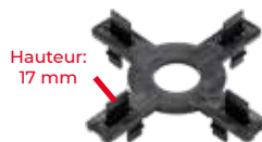
Epaisseur: 2, 3 et 4,5mm